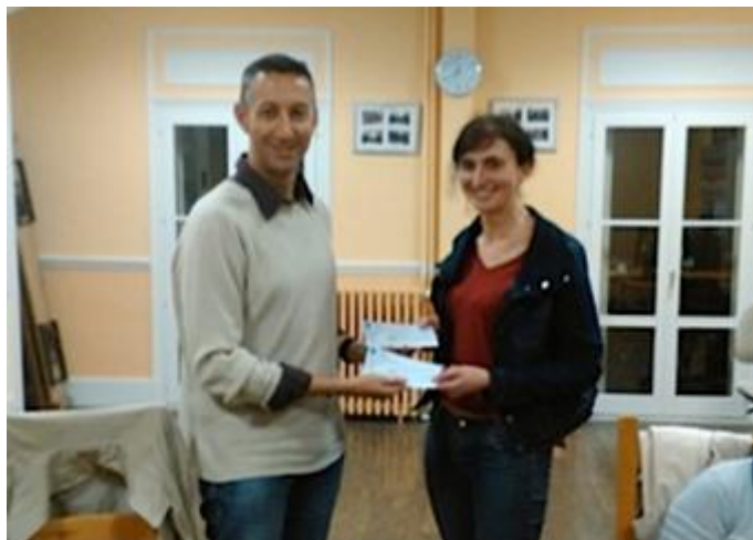
Photo souvenir de la remise de chèque

4 autres membres bénévoles nous ont rejoints et nous nous en réjouissons. Cette année nous avons redistribué une nouvelle fois 19€ par élève soit un peu plus de 4000€ à l'ensemble des écoles du RPI de Vouaumont, grâce à nos efforts.